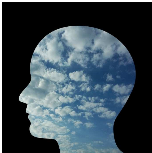
Figura 1 – Mente e pensamentos

Eu nem vejo a hora de lhe dizer Aquilo tudo que eu decorei E depois o beijo que eu já sonhei Você vai sentir, mas... Por favor, não leve a mal Eu só quero que você me queira Não leve a mal