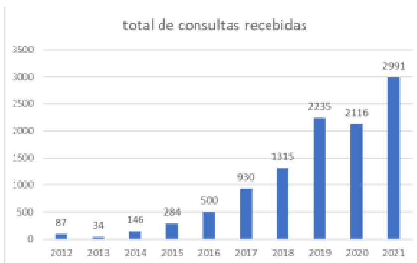
Gráfico 1. Total de Consultas recebidas pelo NAT JUS Goiás versus Anos 2

A seguir, o gráfico 1 demonstra a evolução do número das consultas dos magistrados ao NAT JUS Goiás 1 , evidenciando o crescimento do interesse pelos pareceres técnicos/científicos para consultas formuladas pelos membros do Poder Judiciário, como forma de amparar tecnicamente as decisões judiciais nas demandas relativas à saúde, visto que o impacto financeiro dessas decisões para o sistema de saúde é considerável.