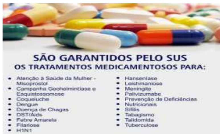
Figura 1: Tratamentos medicamentosos garantidos pelo SUS

O direito à saúde está diretamente conectado ao direito à vida, pois não há como pensar em uma vida (digna) sem o bem-estar físico e mental. A garantia ao acesso a medicamentos, procedimentos e tecnologias em saúde, através de políticas e serviços públicos, afeta positivamente a vida dos cidadãos. Os medicamentos genéricos, o programa Farmácia Popular, a disponibilização de alguns medicamentos feita pelo SUS e a quebra de patentes de grandes laboratórios farmacêuticos foram importantes conquistas na luta por medicamentos.