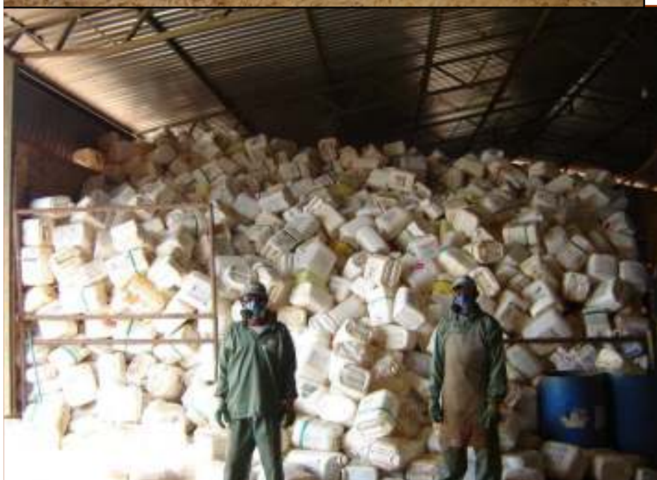
Figura 1: Embalagens laváveis na central de recebimento de Goiânia. (Maio, 2008)