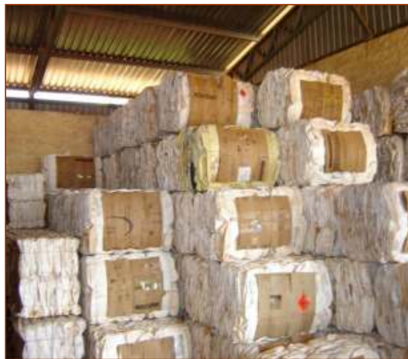
Figura 2: Local de armazenamento dos fardos prensados. (Maio, 2008).