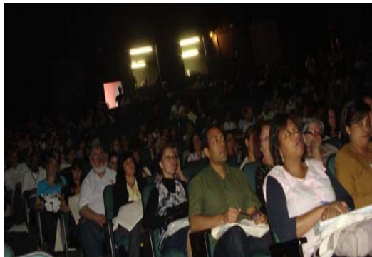
VI Seminário de Saúde Mental e Trabalho do Grande ABC